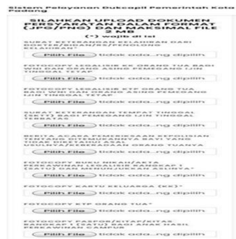
Gambar 2 Persyaratan Akta Kelahiran

Akta kelahiran merupakan dokumen kependudukan yang diperuntukkan kepada setiap bayi yang baru dilahirkan atau penduduk yang belum mempunyai akta kelahiran. Untuk melakukan pengurusan akta kelahiran pada aplikasi online Disdukcapil Kota Padang diperlukan beberapa persyaratan, diantaranya: